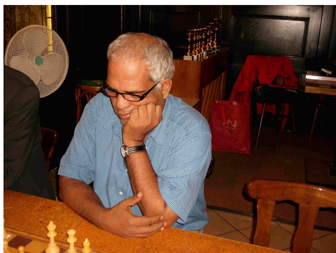
Zweifacher Schnellschach-Staatsmeister wird Fünfter Internationaler Meister „Khaletto“ Mahdy